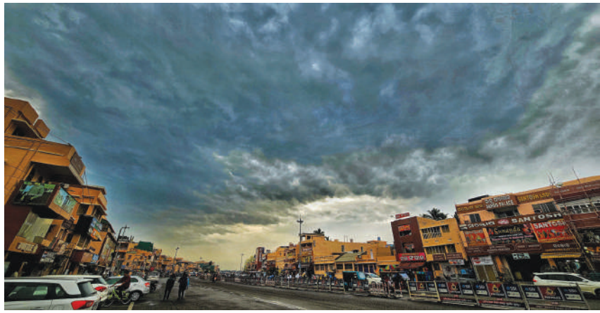
ପୁରୀରେ କଳାହାଣ୍ଡିଆ ମେଘ