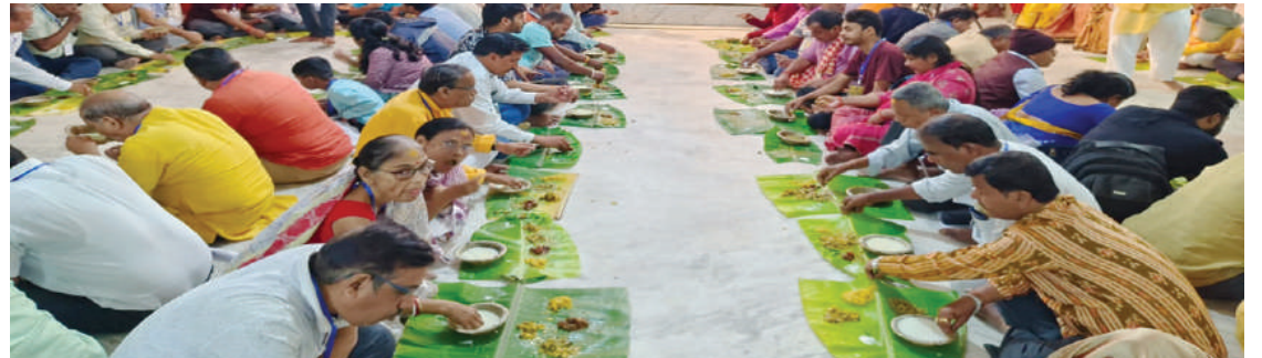
ଶ୍ରୀଜଗନ୍ନାଥ ସାଂସ୍କୃତିକ ପରିଷଦ ପକ୍ଷରୁ ପଖାଳ ଦିବସ