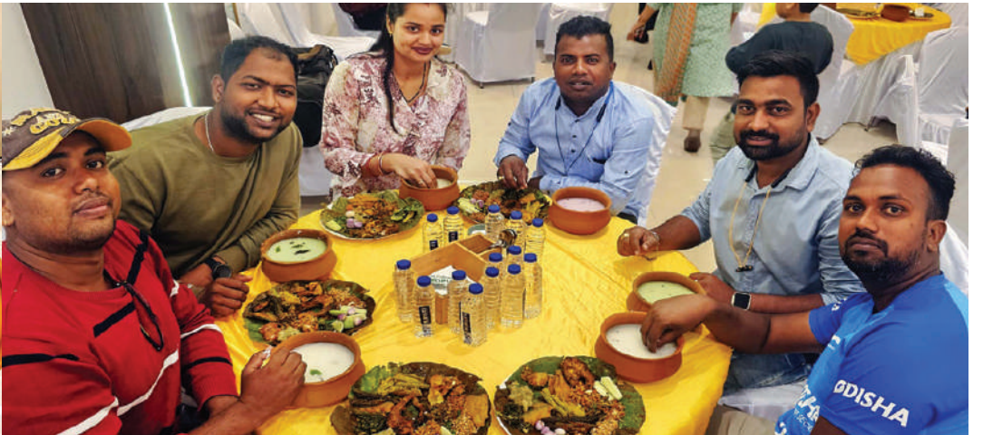
ନମସ୍ତେ ପୁରୀରେ ପଖାଳ ଦିବସ