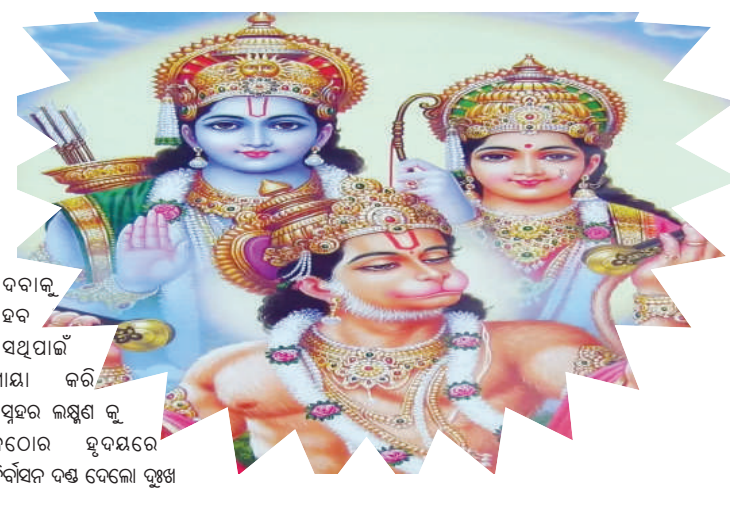
ଦେବାକୁ ହେବ ସେଥିପାଇଁ ମାୟା କରି ସ୍ୱେହର ଲକ୍ଷ୍ମଣ କୁ କଠୋର ହୃଦୟରେ ନିର୍ବାସନ ଦଣ୍ଡ ଦେଲେ ଦୁଃଖ

ସଂପୂର୍ଣ୍ଣ ଦୂର ହୋଇଛି । ସବୁଆଡ଼େ ରାମ ରାଜ୍ୟର ପ୍ରଶାସନ । ତାଙ୍କ ଶାସନରେ ଧୂଳିର ଧରଣୀ ସ୍ୱର୍ଗ ପାଲଟି ଯାଇଛି । ଏହା ମଧ୍ୟରେ କିନ୍ତୁ ରାମଙ୍କ ଜୀବନରେ ଘଟି ଯାଇଛି ଅନେକ ବିପର୍ଯ୍ୟୟ । ପ୍ରଜାଙ୍କ କଷ୍ଟକୁ ସହ୍ୟ କରି ନପାରି ପ୍ରାଣ ପ୍ରାଣ ପଡ଼ି ଜନକ ନନ୍ଦିନୀ ସୀତାଙ୍କୁ ଅନୁଜ ଲକ୍ଷ୍ମଣ ହାତରେ ନିର୍ବାସନ ଦଣ୍ଡ ଦେଇ ତମସା ନଦୀ କୂଳର ଅରଣ୍ୟ ରାଜ୍ୟକୁ ଯିବାକୁ ଦେଇଛନ୍ତି । ସେତେବେଳକୁ ସୀତା ଗର୍ଭବତୀ । ସୀତାଙ୍କ ବିନା ରାମଙ୍କ ଜୀବନ ହୋଇ ଯାଇଛି ନିଷ୍ଠ ଓ ହାହାକାରୀ । ପ୍ରତି ମୁହୂର୍ତ୍ତରେ ସୀତା କଥା ଭାବି ତାଙ୍କର ବନ୍ଧ ବିଦର୍ଷ ହୋଇଯାଏ । ବିଚାରି ଜିବନରେ ସୁଖ କଣ ଜାଣିଲା ନାହିଁ । ରାଜ ରାଣୀ ହେବାର ସ୍ୱପ୍ନ ଦେଖୁ ଦେଖୁ ସୀତାଙ୍କ ସହ ୧୪ ବର୍ଷ ପାଇଁ ବନବାସିନୀ ହେଲା । ବଣ ପାହାଡ଼ ଓ ଜଙ୍ଗଲ ଭିତରେ ସେମାନଙ୍କର ଯୁଗଳ ଜୀବନକୁ ଦେବ ମଧ୍ୟ ସହିଲା ନାହିଁ । ଅହଂକାରୀ ମହାପ୍ରତାପି ଲଙ୍କା ର ରାଜା ଦଶନାନ ରାବଣ ଦ୍ୱାରା ସେ ହେଲେ ଅପହୃତ । ଭୟଙ୍କର ରାକ୍ଷାସ ମାନଙ୍କ ମେଳରେ ୧୩ ମାସ ବନ୍ଦୀ ଜୀବନ କଟିଲା । ତାକୁ ଉଦ୍ଧାର କରିବାପାଇଁ ଅଧିକ ସମୁଦ୍ରେ ବନ୍ଧ ବାନ୍ଧିଲେ । ଭୟଙ୍କର ଯୁଦ୍ଧରେ ରାବଣ କୁ ସର୍ବଦ୍ୟ ନିହତ