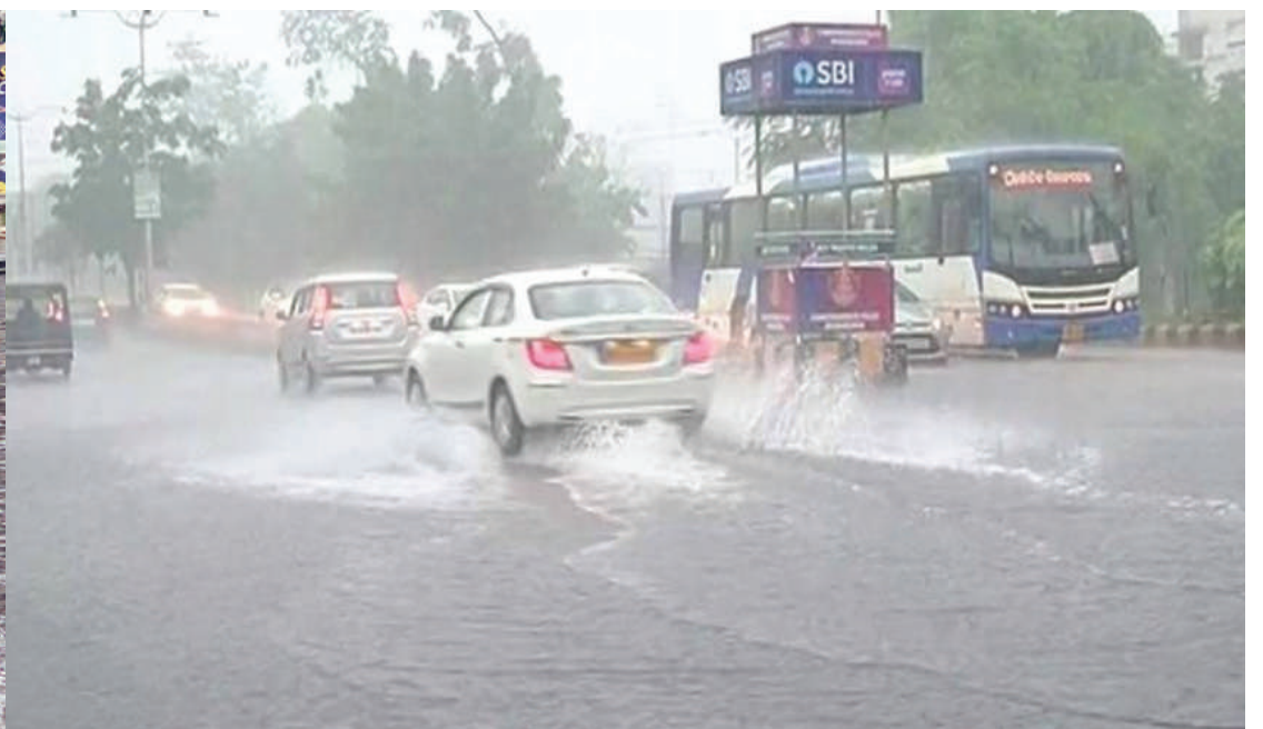
ଭୁବନେଶ୍ୱରରେ ଜମିରହୁଛି ବର୍ଷାପାଣି