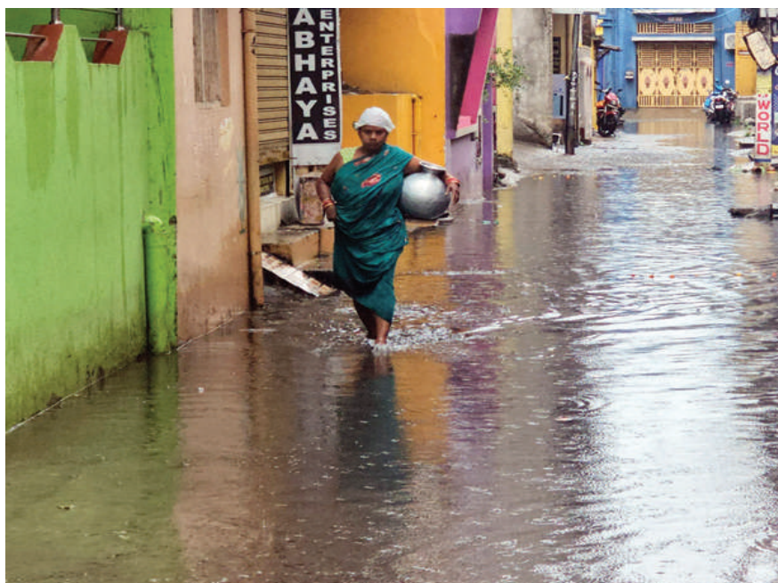
ଅସରାଏ ବର୍ଷାପାଇଁ ନାଳପାଣି ରାସ୍ତାରେ