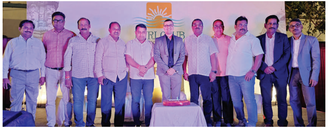
ପୁରୀ କ୍ଲବର ୯୬ତମ ପ୍ରତିଷ୍ଠା ଦିବସ ମହାସମାରୋହରେ ସଂପନ୍ନ